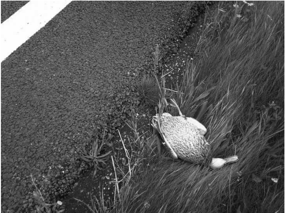
kwetsbaarheid van mens en natuur

een weg: de mens die weet heeft van kwetsbaarheid en afhankelijkheid van een grotere werkelijkheid die zijn eigen persoonlijke kennen en vermogen te boven gaat, kan in vrijheid en bescheidenheid, maar met moed en hoop verder gaan. Ook omdat hij weet dat vanuit de beloofde toekomst zijn eigen perspectief omvangen wordt door een groter, genadig en genezend perspectief.