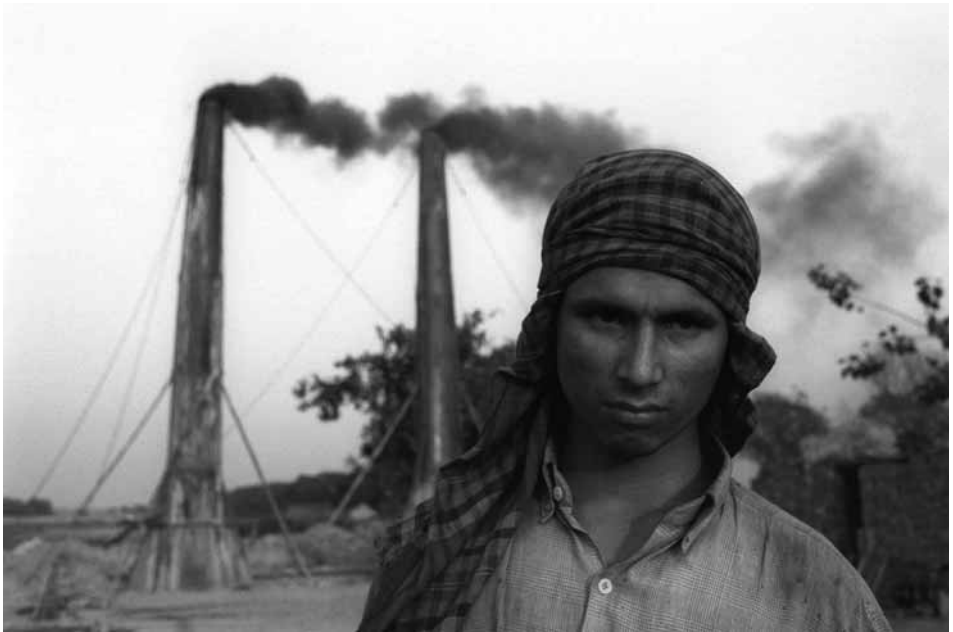
gelijke kansen voor ontwikkelingslanden

investeringen. Dan gaat het om de kosten van aanpassing aan de onafwendbare gevolgen van klimaatverandering én om het zo veel mogelijk klimaatneutraal realiseren van de noodzakelijke economische groei. Rijke landen hebben - ook in hun eigenbelang - de taak en de plicht om daaraan bij te dragen door het beschikbaar stellen van kapitaal en niet vervuilde technologie. Daarbij is het ook van belang om attent te zijn op wat er binnen die samenlevingen en culturen zelf al aanwezig is aan inzichten en middelen.