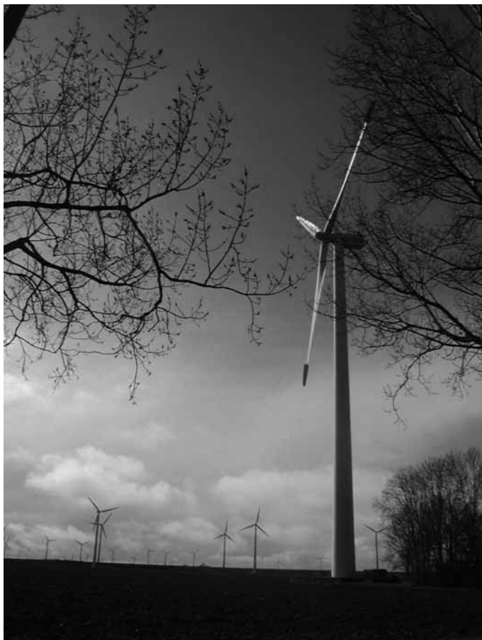
perspectieven voor verandering

In deze oproep sluiten wij ons aan bij de vele kerkelijke, internationale en oecumenische verklaringen en hoopgevende perspectieven voor praktische verandering die de laatste decennia het licht zagen, maar in de Nederlandse kerken en samenleving nog onvoldoende aandacht en weerklank vonden.