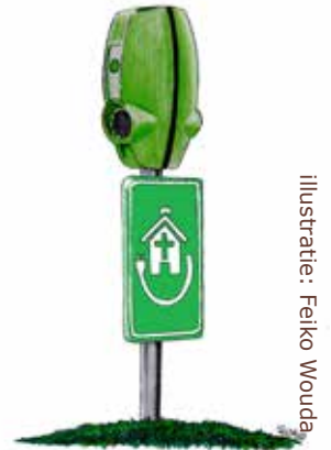
Illustratie: Felko Wouda