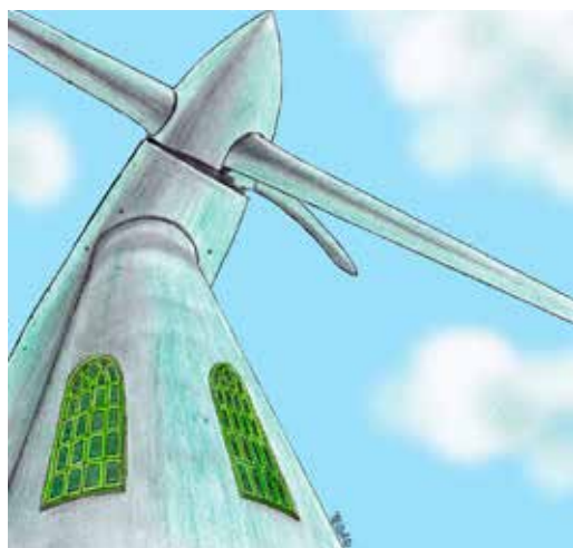
illustratie: Feiko Wouda

Het doel van de brochure is om te laten zien dat duurzaamheid in wezen een levensbeschouwelijk en religieus vraagstuk is en daarmee dus tot het hart van het geloof en de kerk behoort. Klimaatverandering en alles wat ermee samenhangt, roept nieuwe vragen op die raken aan ons leven en dus ook aan geloof, theologie en spiritualiteit. Deze brochure is een aanzet om met dit soort vragen aan de gang te gaan. Klimaatverandering wordt doorgaans als een probleem opgevoerd. Je mag opeens van alles niet meer: niet meer vliegen, geen vlees eten. De auteurs van de brochure nodigen u uit om eens anders tegen klimaatverande-