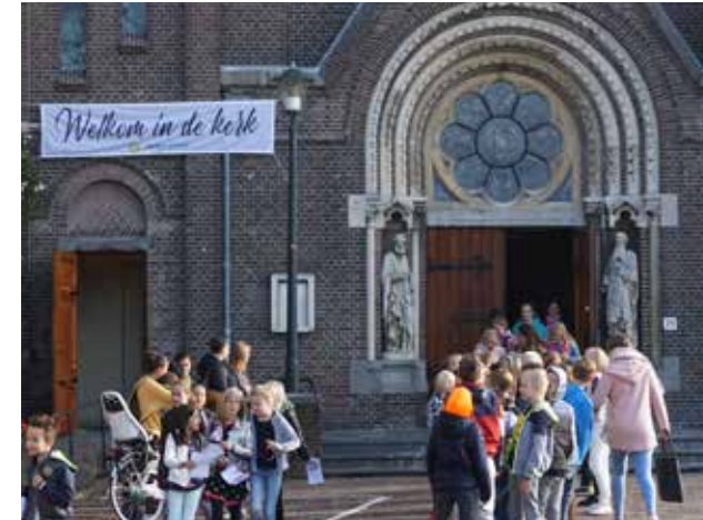
HH Petrus en Pauluskerk - Leidschendam

Gastvrijer worden als kerk is een proces. De meeste kerken hebben geen 'follow-up' gepland na Kerkproeverij, zoals een informatieavond of Alpha-cursus. Het is aan de nieuwe bezoekers zelf om te beslissen of ze nog eens naar de kerk komen. Terugkijkend geeft één op de vijf kerken aan dat enkele Kerkproeverij-bezoekers naderhand zijn teruggekomen.