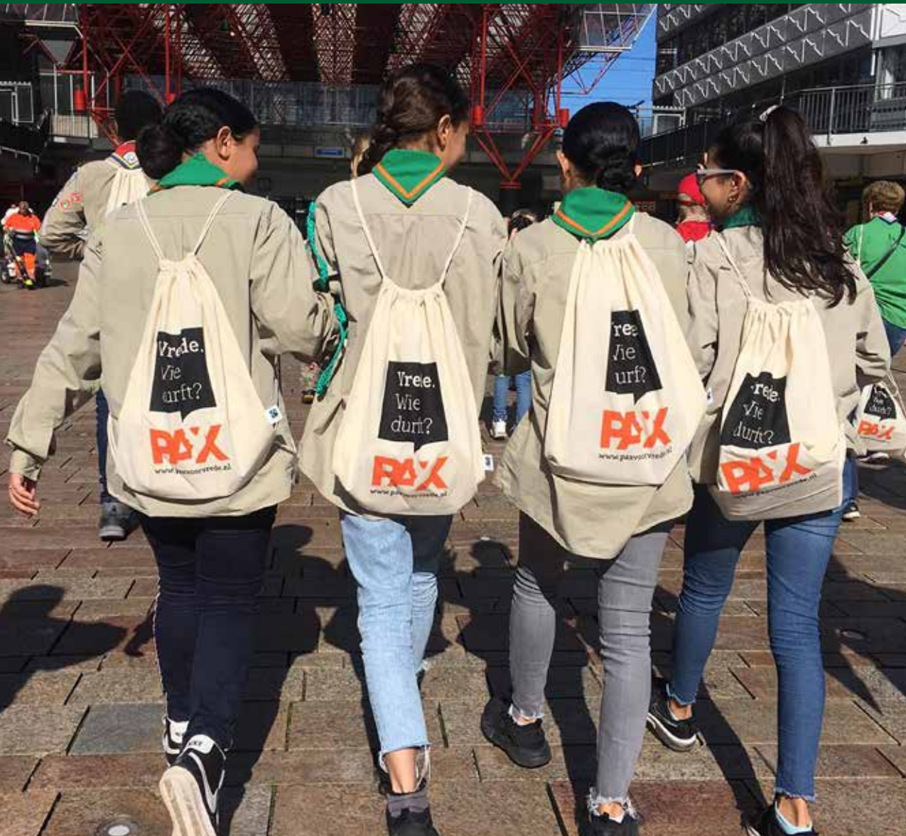
Walk of Peace, 21 september Almere