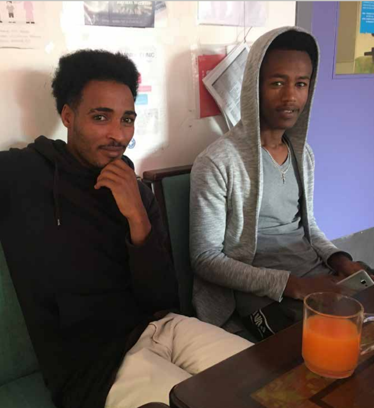
Dublinclaimanten uit Eritrea