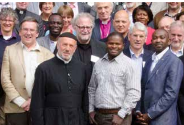
Deelnemers bijeenkomst NCF