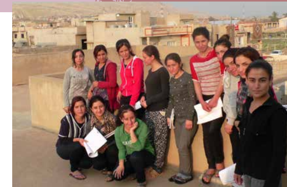
Yezidi-studentes, studeren op het dakterras

Yezidi's zijn Koerden en aanhangers van een geloofsovertuiging waarin men christelijke, islamitische, en andere religieuze elementen terugvindt. Er zijn nu nog ongeveer 1 miljoen Yezidi's.