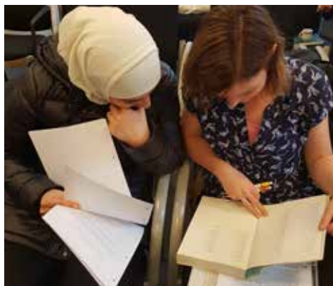
Overleg tussen twee deelnemers tijdens de bijeenkomst

In het christendom verschuift volgens Harry Mintjes het zwaartepunt van christocentrisch, theocen-