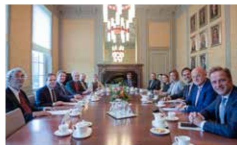
Ontmoeting Raad van Kerken met leden kabinet

De kerken aangesloten bij de Raad van Kerken hebben in september een kennismakingsgesprek gevoerd met minister-president Mark Rutte, de vicepremiers Schouten, Ollongren en De Jonge en minister Grapperhaus. Aan de orde kwamen onder meer thema's als de vierde levensfase, flexibilisering van arbeid, 'religiestress' en vluchtelingen.