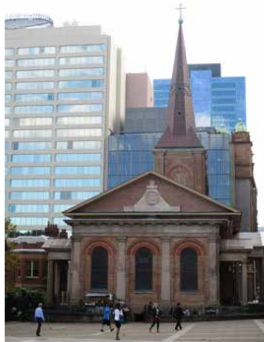
De kerk: ‘sacrament van de Godsontmoeting’

Zo’n verandering komt nooit zomaar uit de lucht vallen. Theologen hadden al termen gebruikt als oer-sacrament of wortel-sacrament en Schillebeeckx had Christus al betiteld als ‘sacrament van de Godsontmoeting’. Maar misschien belangrijker: vanaf het begin van het Tweede Vaticaans Concilie (1962-1965)