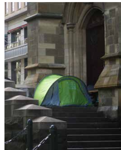
Armoede in het zicht

inloophuizen. Samen 36 miljoen. Dat was in 2012 ongeveer 29 miljoen. De forse stijging - ondanks krimp in leden en middelen van de kerken! - leek vooral te wijten aan de economische crisis. Inmiddels lijkt de crisis voor velen achter de rug. Maar de tweedeling groeit en een harde kern van mensen blijft te maken hebben met armoede en schulden.