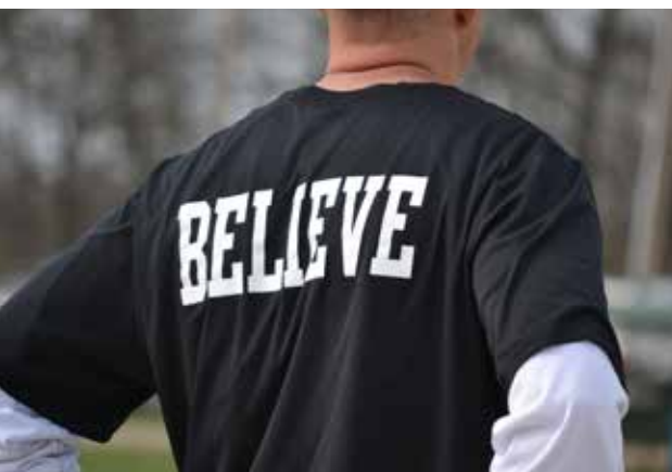
Geloven en verbeeldingskracht

En toch blijven zowel gelovigen als ongelovigen elkaar nog bestoken met godsbewijzen of met het tegendeel, het bewijzen dat 'de hypothese God' niet langer met goed intellectueel fatsoen verdedigd kan worden. Het