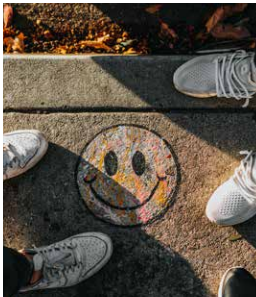
Optimistisch over de samenwerking

MissieNederland presenteert zichzelf nadrukkelijk als netwerkorganisatie. De Raad is een formeler verband, dat in principe niets doet zonder dat alle lidkerken het ermee eens zijn. Het is het type organisatie waarin hiërarchie een rol speelt, en procedures lang kunnen zijn. Geen aantrekkelijk beeld voor een