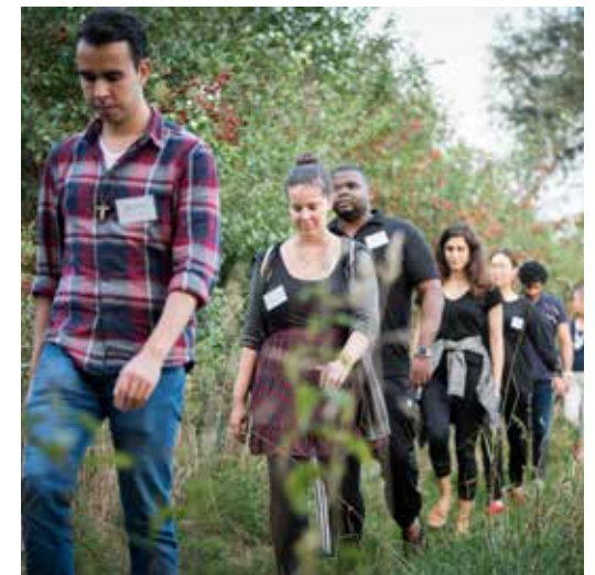
Jongeren te voet (bijeenkomst 70 jaar Wereldraad)

Het is de vraag hoe die benadering zich verhoudt tot de klassieke opvattingen over pelgrimages van orthodoxen en rooms-katholieken. En het is evenzeer een vraag hoe die persoonlijke benadering betekenis kan hebben voor een geëngageerde pelgrimage waartoe de Wereldraad oproept; een pelgrimage van gerechtigheid en vrede. Frits de Lange is gevraagd om daar verder op in te gaan.