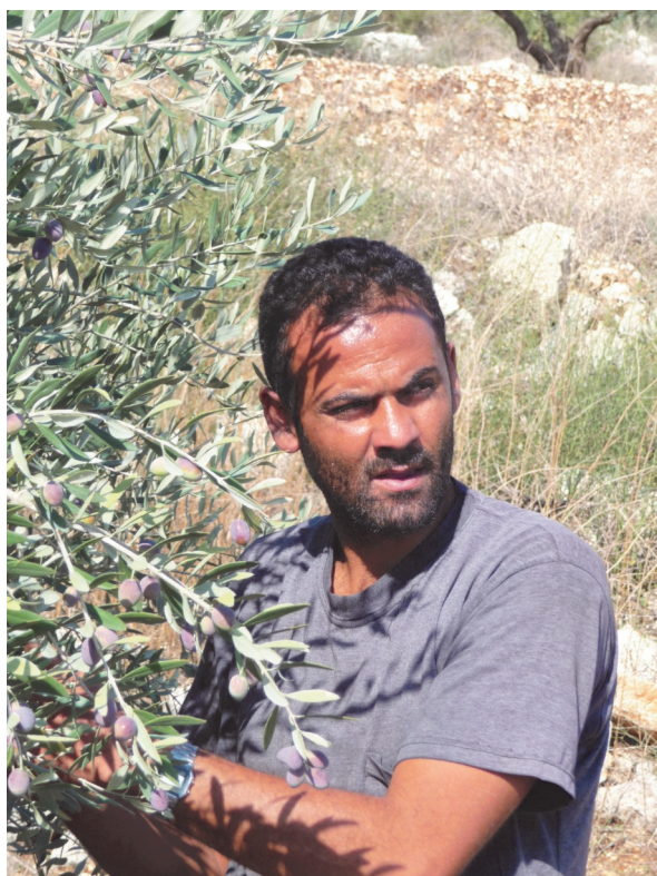
Olijvenpluk in Palestina

De Raad stelt verder dat binnen de kerken ruimte bestaat voor theologische verbondenheid met het Joodse volk en voor solidariteit met de Palestijnen. Wel wijst hij op de bijzondere situatie van Palestijnse christenen. 'De Palestijnse christenen nemen in het geheel een eigen positie in, aan de ene kant getroffen door de maatregelen die alle Palestijnen treffen, aan de andere kant is er de zorg als christelijke minderheid te zoeken naar waardering en erkenning.