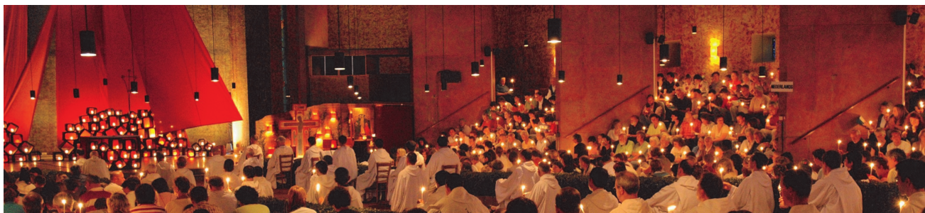
Viering in Taizé

Als voorbereiding op de Jongerenontmoeting woonden twee broeders van Taizé in maart en april een aantal gebedsbijeenkomsten bij op verschillende plekken in Nederland.