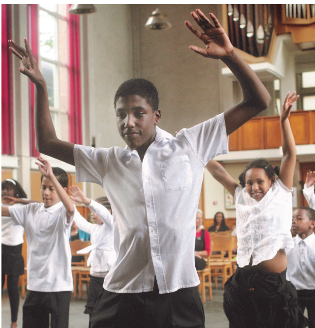
Dansen op muziek in soorten en kleuren

Daartoe importeerden we het handelsmerk 'Nacht der Kerken', meegenomen uit een van onze partnersteden, in Dresden. Zou zoiets ook in een havenstad lukken, waar cultuur