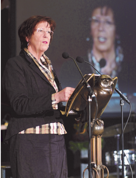
Annemarie Jorritsma op de bijeenkomst in Utrecht