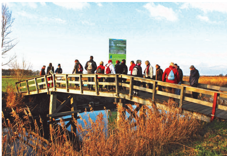
Voettocht in de Advent

De aangesloten kerken bezinnen zich op dit vernieuwd oecumenisch mandaat en in het verlengde daarvan op nieuwe mogelijkheden voor de oecumene in de toekomst.