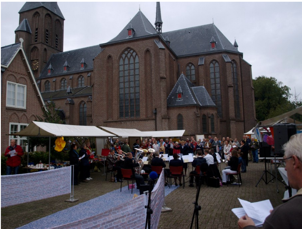
opening van de kerkenmarkt

De Kerkenmarkt 2007 wordt in november met de betrokkenen geëvalueerd en dan zal worden vastgesteld of dit evenement een vervolg zal krijgen.